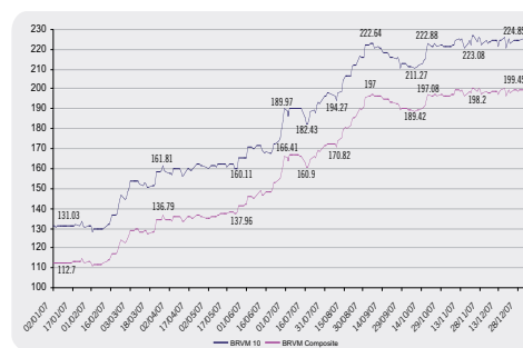
Evolution des indices boursiers en 2007

Les indices boursiers ont suivi l'évolution du marché et ont affiché, en fin 2007, des valeurs jamais atteintes par la BRVM depuis sa création. En effet, les indices BRVM Composite et BRVM 10 ont terminé l'année en hausse de 77,05% et 71,71%, à 199,45 et 224,85 points, respectivement. Notons que cette tendance à la hausse a été perturbée à la fin du 3 ème trimestre 2007 du fait notamment de la baisse d'activité observée sur les principaux secteurs moteurs de la BRVM, à savoir «Services Publics» et «Agriculture» mais également à la régression ponctuelle des cours des principaux titres de capital, particulièrement, SONATEL SN, SAPH CI et BICI CI.